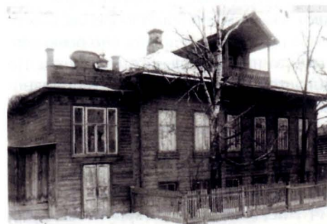
Дом Сергеевых. Ижевск на улице Красной (бывшая Куренная)