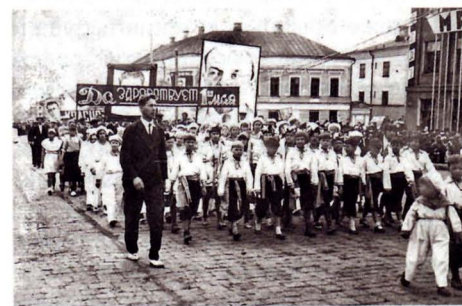
Пионеры на марше. Ижевские дети. Начало XX века

Доктор нередко сам делал микстуры, которые в ижевских аптеках (часто случалось такое!) не изготавливали из-за отсутствия нужных компонентов. Недостающие дефицитные средства для микстур ему привозили из Москвы. В докторском кофре было специальное отделение для пузырьков с микстурами. Иногда родителей заболевших де-